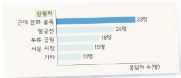
(그래프 자료의 효과를 묻는 문제에서 '설문 조사의 결과를 한눈