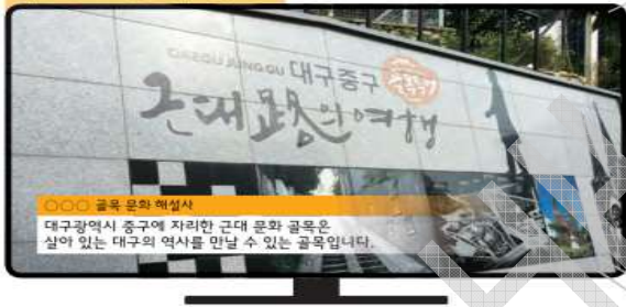
자료 ① 텔레비전 뉴스

자료 ① - 텔레비전 뉴스 (대구 중구 근대 문화 골목에 대해 소개하고 있는 텔레비전 뉴스 보도 자료)