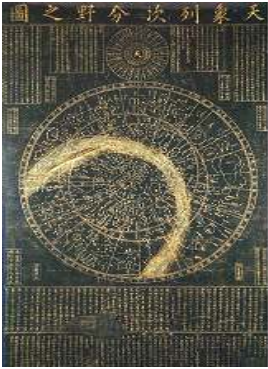
< 보 기 >

6. 다음 지도가 처음 제작된 시기의 문화에 대한 설명으로 옳은 것을 <보기>에서 고른 것은?[3점]