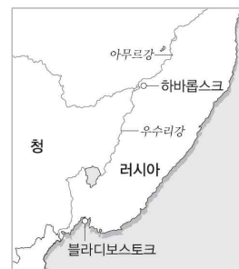
▣ 아무르 강과 우수리 강(P. 67)