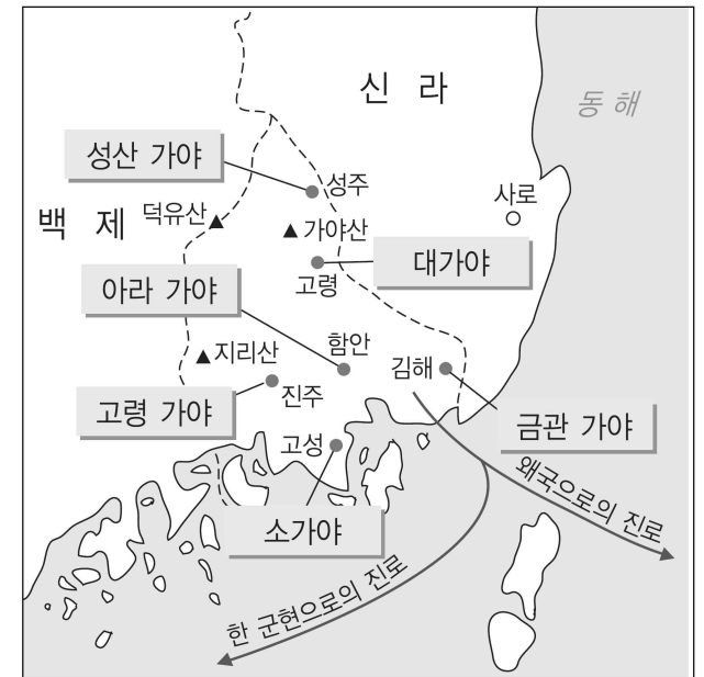
<가야 연맹의 구성>